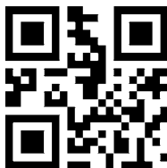
Anfangszeichen mit ausgeben